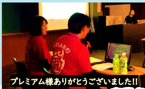
プレミアム様ありがとうございました!!