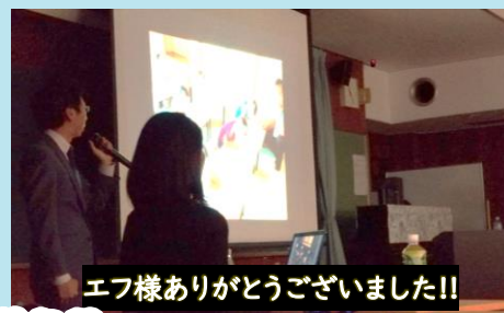
エフ様ありがとうございました!!